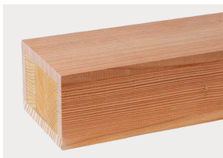
tr Lärche europäisch staticwood Spezialaufbau