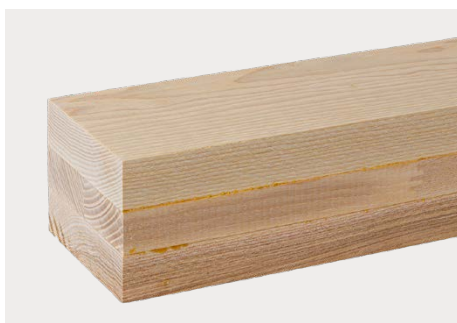
Esche Natur dkd Decklage weiss

Gerne prüfen wir auch die Möglichkeit, Kombinationen aus verschiedenen Holzarten für Sie zu fertigen. Immer wieder gefragt sind z.B. Lärche/Fichte, Arve/Fichte, Fichte/Tanne gedämpft etc.