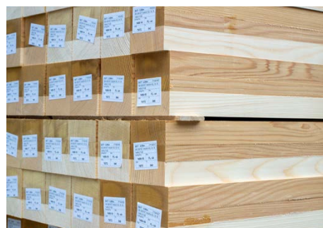
tr Tanne gedämpft/Fichte Spezialaufbau